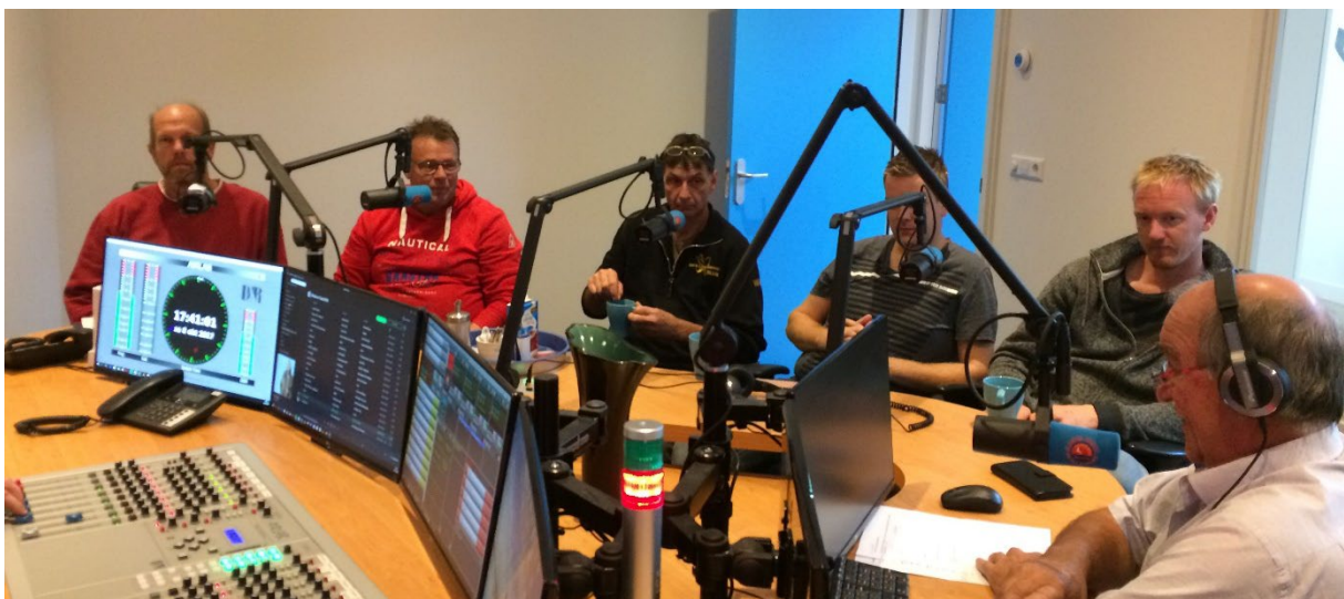
Figuur 1 : Studio 1 Radio Texel