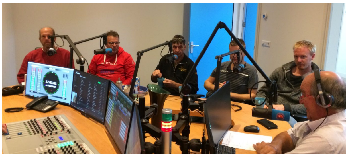
Figuur 1 : Studio 1 Radio Texel